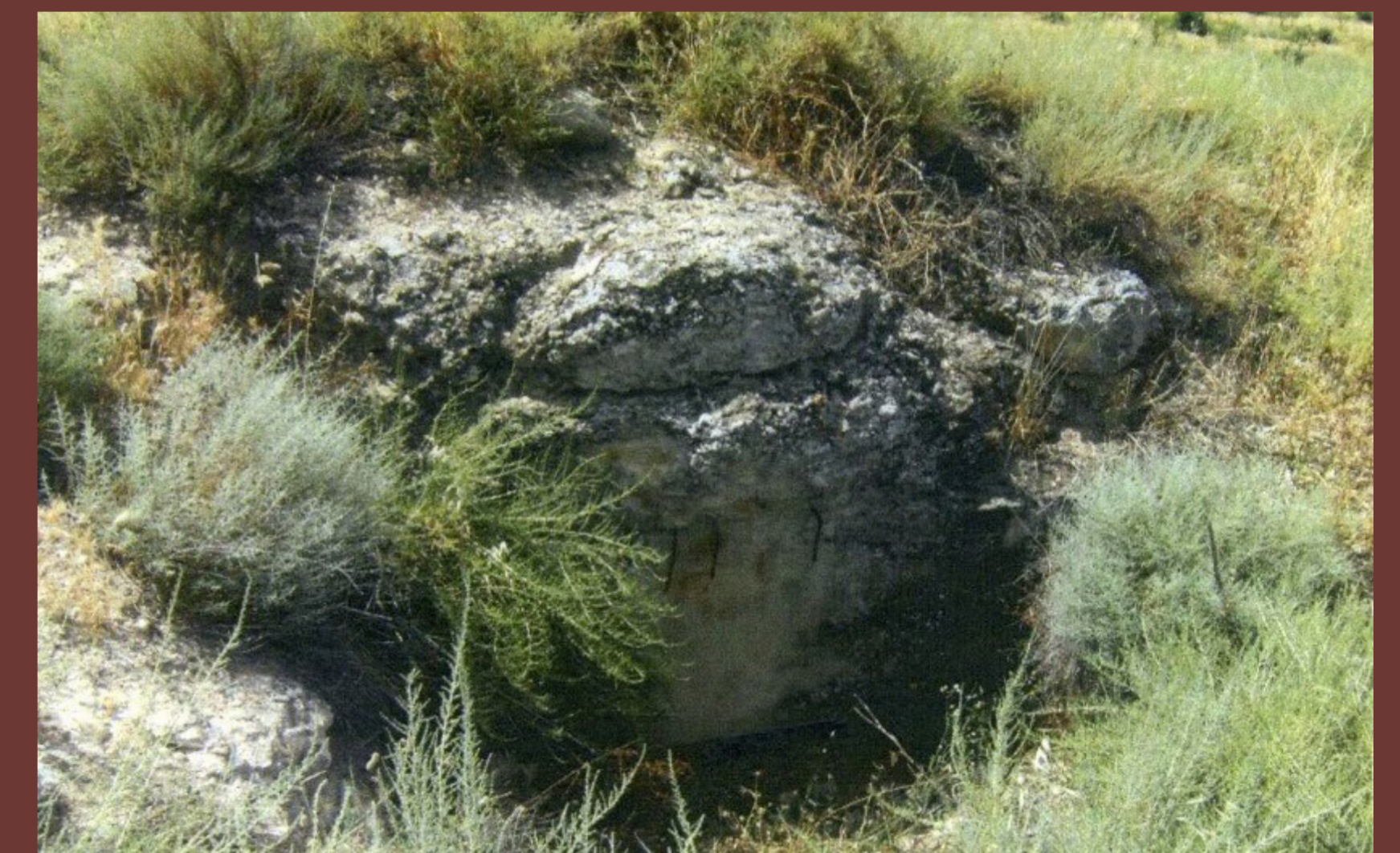
A la Partida del Telègraf trobem aquest niu de metralladores, una construcció de pedra seca amb volta de canó reforçada amb formigó armat (element inventariat al POUM de Vilagrassa).