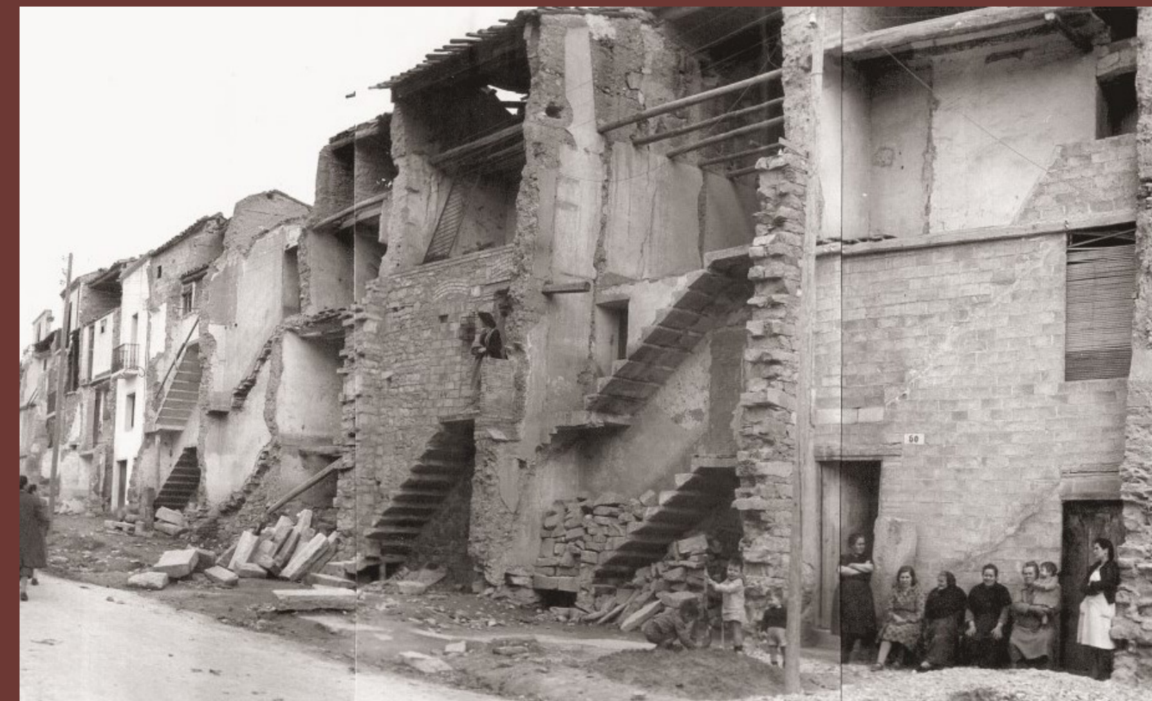
Raval del Carme, Tàrrega 1939